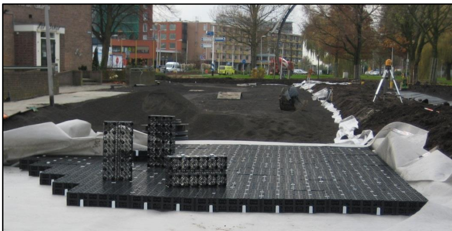
Aquaflow® Argimedes met permavoid in Gouda