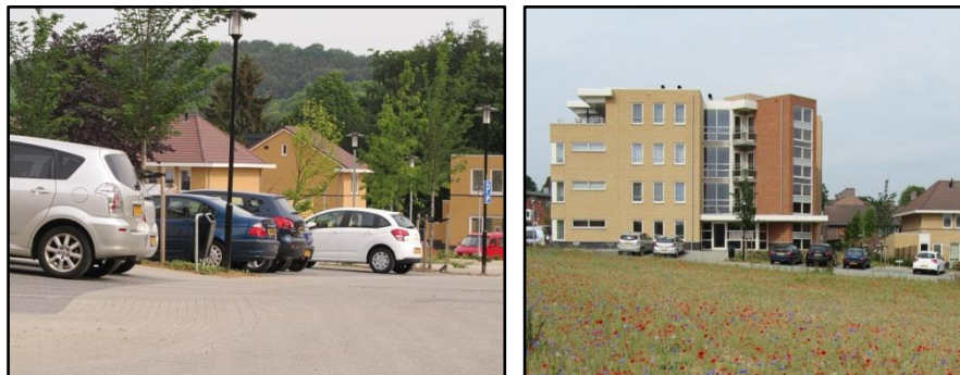
1200 m 3 waterberging met Aquaflow® in sterk hellend gebied met ondergrondse drempels

Hemelwater kan zich in de Aquaflow fundering, met 40% holle ruimte, > 100 meter/uur horizontaal verplaatsen. Om de berging in hellende gebieden effectief te kunnen benutten zijn ondergrondse drempels nodig.