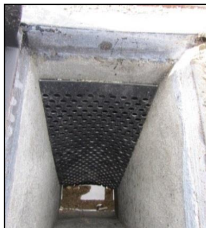
Zeefscherm met afstandhouder (*)