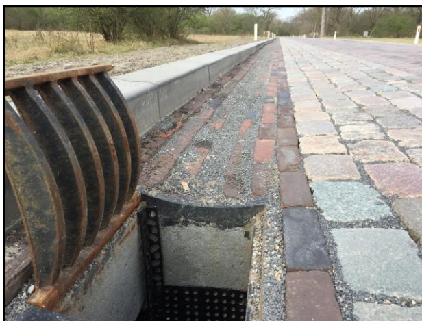
Via de paddentrap klimmen amfibieën door het rooster