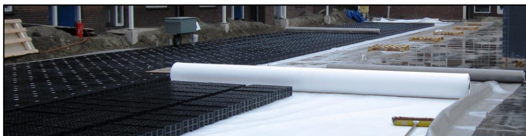
Aanbrengen Permavoid funderingsvervanger (75mm, 85mm of 150mm hoog) voor waterberging