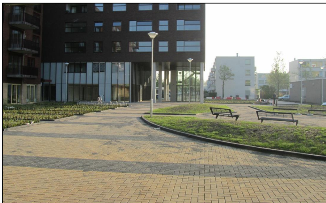
De daktuin kan gebruik maken van het eronder gebufferde hemelwater