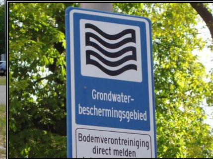
Breda Airport is beschermd gebied. Parkeren op grastegels met daaronder olieverwerkend filterdoek PF90