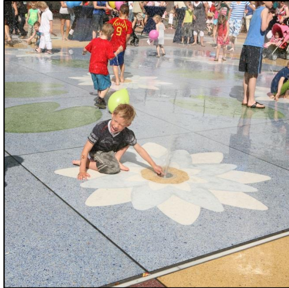
Hemelwater uit het Aquaflow systeem wordt gebruikt voor water kunstwerken. Leiderdorp: "Uitzicht op Arcadie" (Hans van Lunteren). Veerplein Vlaardingen