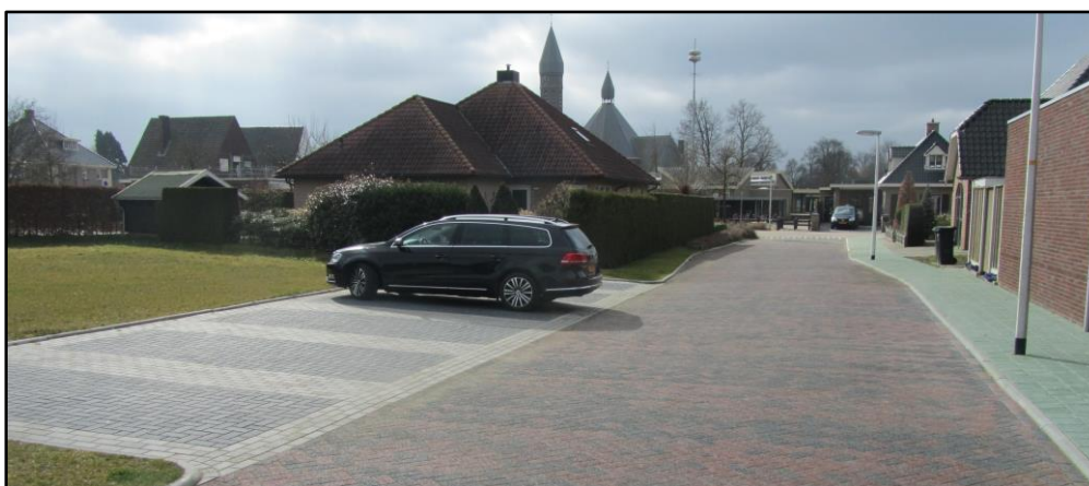
Straat met poreuze stenen in de kleur genuanceerd rood-antraciet

Aquaflow B.V. Postbus 58103 1040 HC Amsterdam Nederland-NL