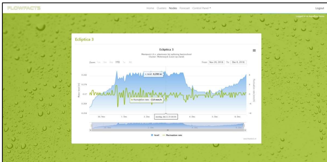
Flowfacts met webbased presentatie, real time raadpleegbaar via PC, smartphone, tablet of hoofdpost.

Flowfacts® wordt aangesloten op het LORA netwerk van KPN en is daardoor energiezuinig. De informatie is extreem goed beveiligd. Zowel historische als actuele meetgegevens zijn realtime zichtbaar op een gebruiksvriendelijk bijgeleverd online platform. De gebruiker kan zelf, zonder externe ondersteuning, meetpunten toevoegen, wijzigen en groeperen.